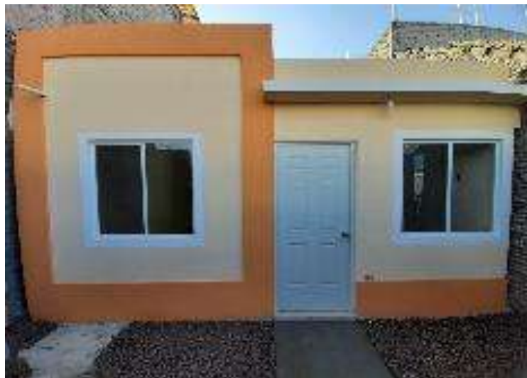
PVHo1-101 Ermita Zaragoza Iztapalapa, Ciudad de México