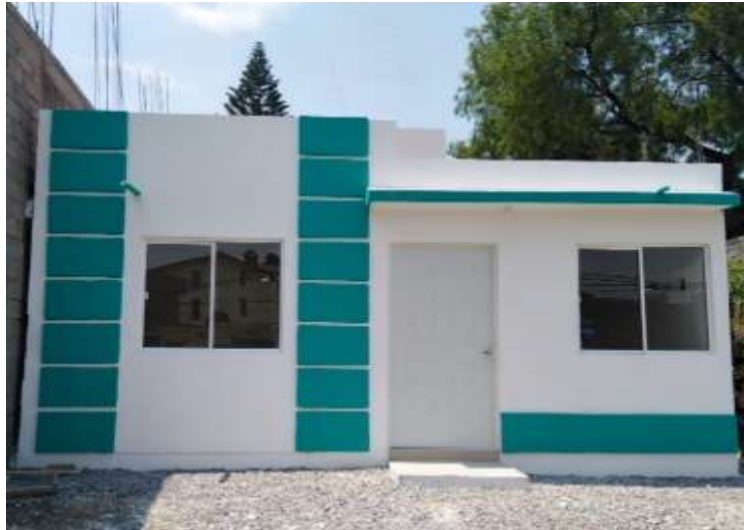
PVHo6-173 Iztapalapa, Ciudad de México Santa Marta Acatitla

Se ha continuado en alianza con el Fideicomiso Provivah con la construcción de vivienda para los afectados por los sismos de 2017, en la Ciudad de México en la Delegación Iztapalapa, se construyeron 139 casas y se tiene en proceso de construcción otras 86. El costo total fue de: $3,400,000.00